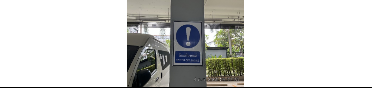
รูปที่ ๗7.3 ป้ายห้ามติดเครื่องยนต์