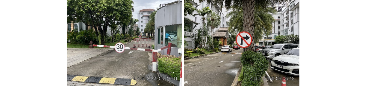
รูปที่ ๗7.2 ป้ายจำกัดความเร็วของรถยนต์