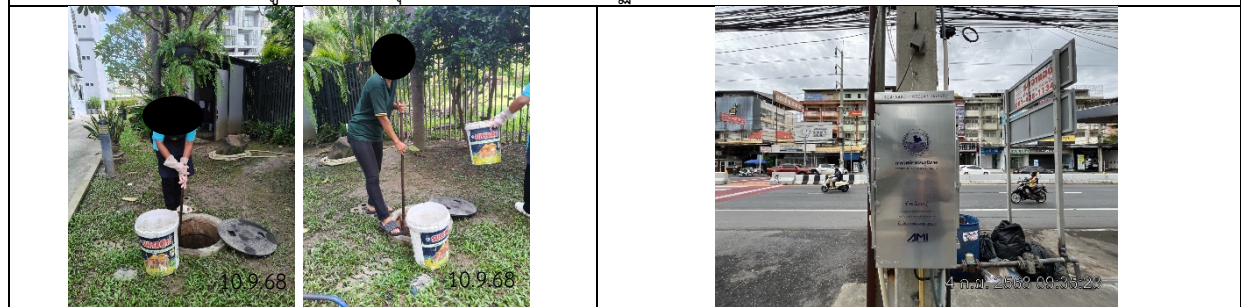
รูปที่ ผ7.19 เจ้าหน้าที่ตักกากไขมัน