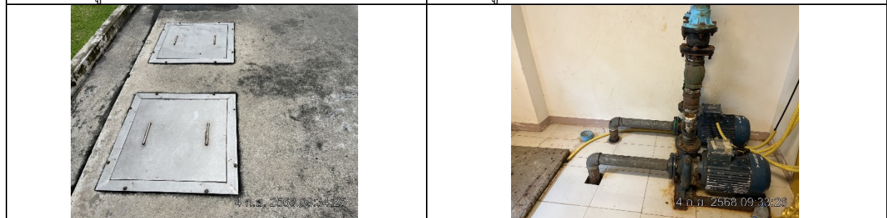
รูปที่ ผ7.21 บ่อหน่วงน้ำฝน