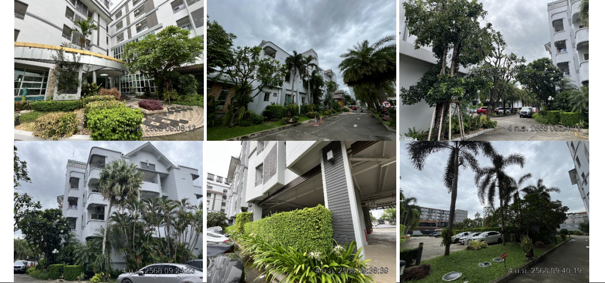
รูปที่ ๗7.4 พื้นที่สีเขียวภายในโครงการ