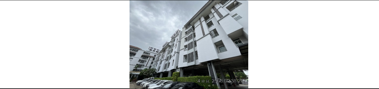
รูปที่ ๗7.1 ช่องเปิดออกสู่ภายนอกของผนังด้านนอกอาคาร